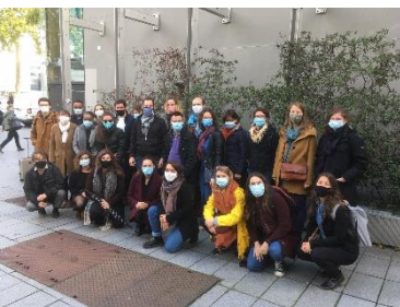
Oct 2020 – séminaire Inter-DLA R en visio