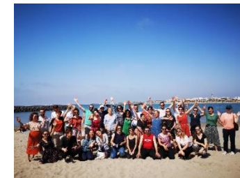
Octobre - RNAESS