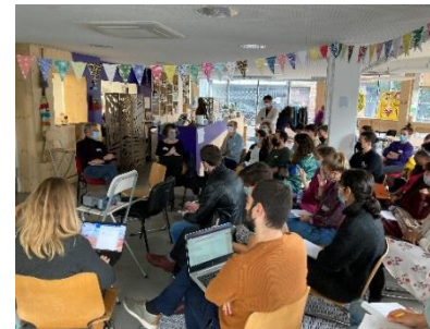
Oct : séminaire Inter-DLA R à Lille