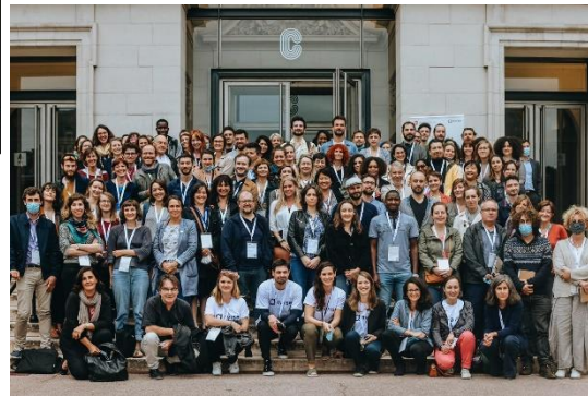
Juillet - Belles rencontres du DLA à Paris